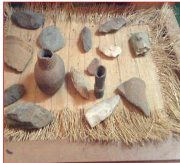
Photo n°1: parc de la Lopé Le parc de la Lopé présente un témoignage remarquable de peuplement 5500 av J-c Photo n°2: des objets sortis de la grotte d'Iroungou datant de 14 -ème siècle avant notre ère

Le Gabon possède un riche patrimoine archéologique avec des sites archéologiques à protéger et valoriser avec un abondance de plusieurs sites des époques différentes