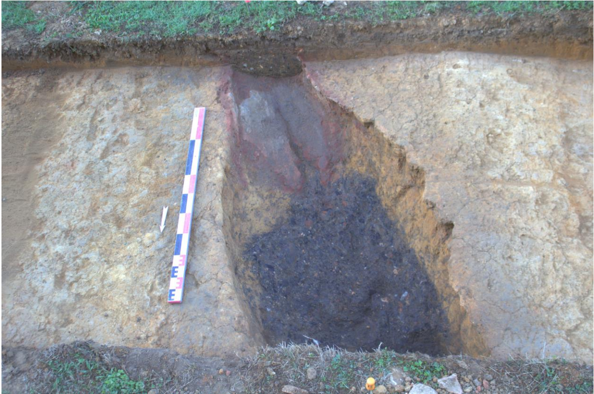
Fig. 1 : Four 1005 avec niveau charbonneux en place au nord et alandier vidé au sud