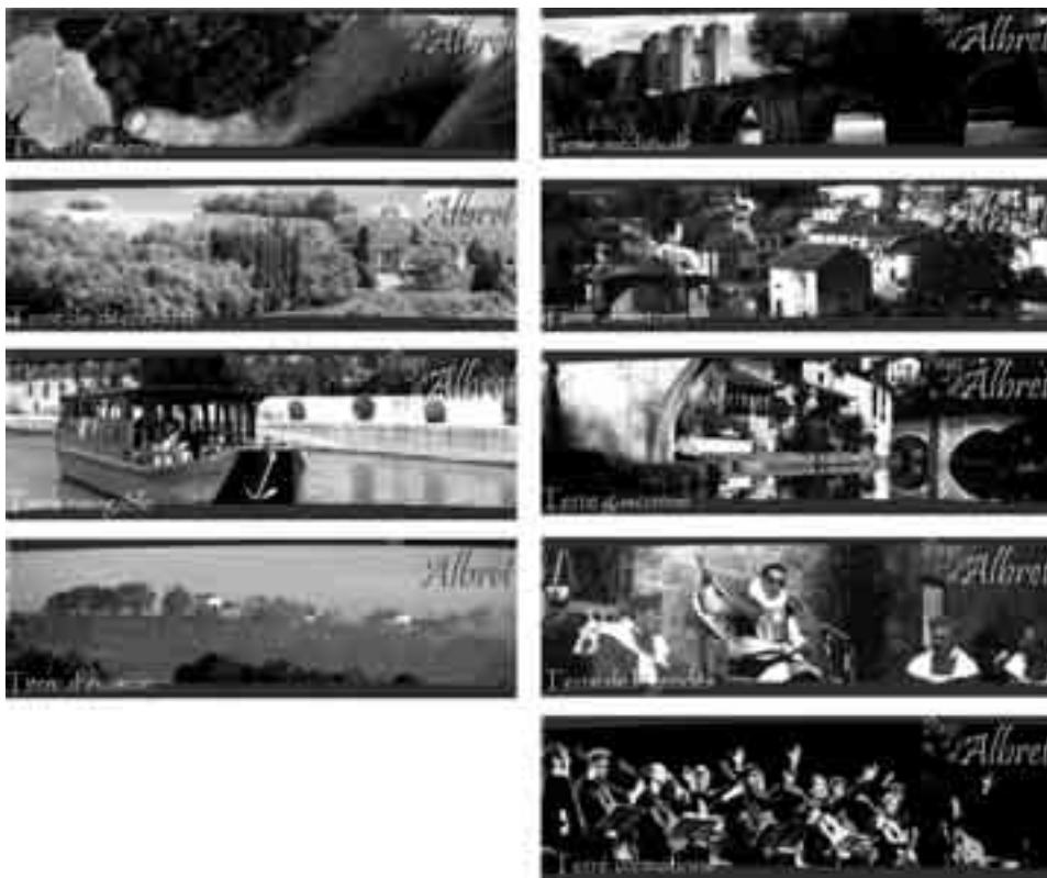
FIGURE 7 LES BANDEAUX QUI ILLUSTRENT LA PAGE D'ACCUEIL DU SITE WEB DE L'OFFICE DE TOURISME DU PAYS D'ALBRET : ENTRE AMBIANCE ET DÉTERRITORIALISATION

face à un aliment : le goût, l'odorat, la vue et le toucher principalement. Dans la photographie de la figure n.º 7 la grappe de raisin dans la main de l'homme souligne la dimension sensuelle et charnelle des produits du terroir.