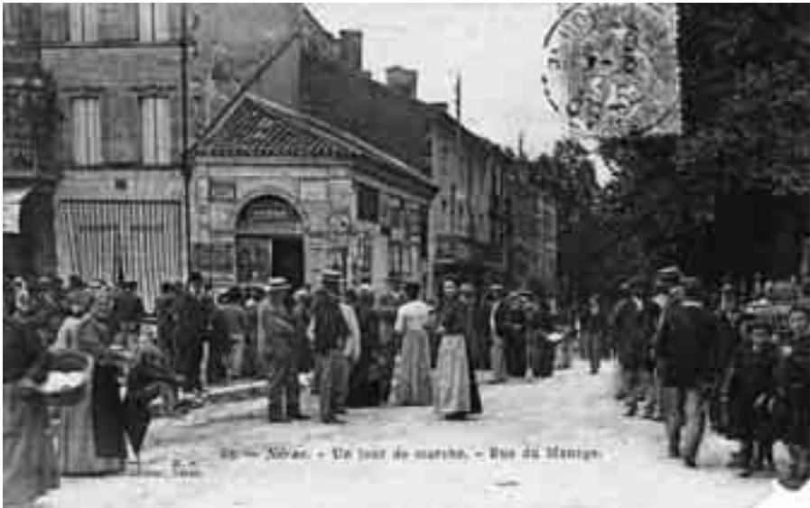
Nérac, un jour de marché - Rue du manège (carte postale).