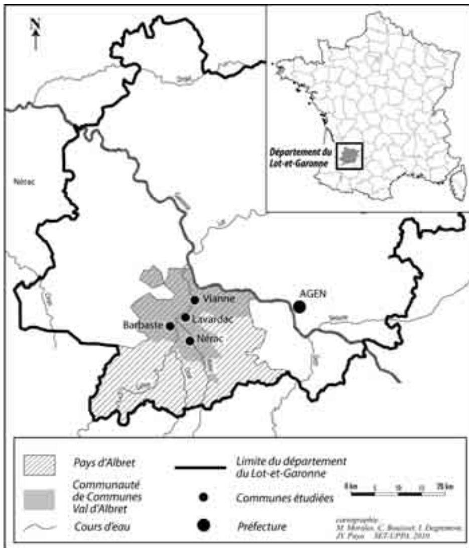
FIGURE 1 LE PAYS D'ALBRET AUJOURD'HUI

Officiellement, le nom ne réapparaît que dans les années 1990 par le biais d'une nouvelle loi d'orientation pour l'Aménagement et développement du territoire (1995) qui réhabilite la notion de pays afin de «réduire la fracture