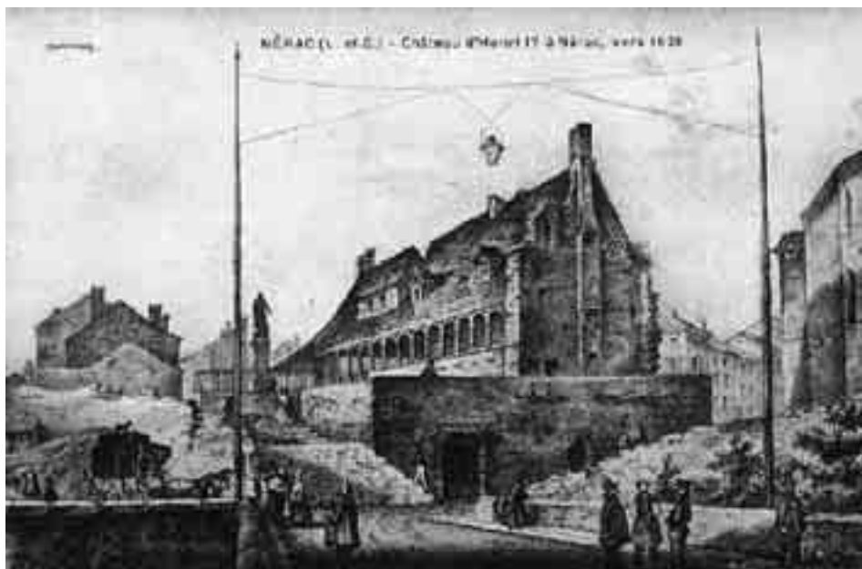
FIGURE 2 LE CHÂTEAU D'HENRI IV À NÉRAC VERS 1828