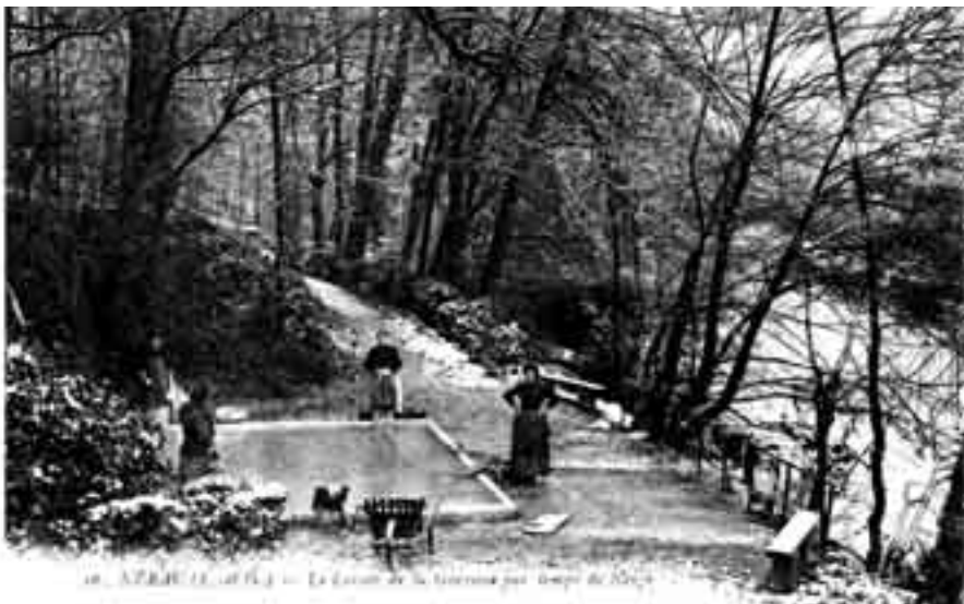
Nérac, le lavoir de la Garenne par temps de neige (1913) (carte postale).