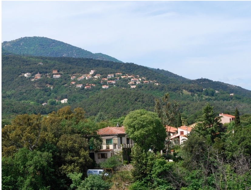
Photo 1 : Le lotissement « Domaine des Albères » vu depuis le centre du village de Laroque-des-Albères.

démographiques générales de la région Languedoc-Roussillon où, selon les chiffres de l'INSEE, un habitant sur deux n'est pas né dans sa région de résidence. Les retraités venus d'autres régions françaises sont particulièrement représentés dans la population permanente des lotissements étudiés. Beaucoup de logements sont toutefois des résidences secondaires et les acheteurs étrangers originaires d'Europe du Nord sont devenus de plus en plus nombreux, si bien que dans certains lotissements comme dans celui du Domaine des Albères, la population permanente est minoritaire.