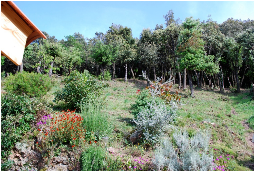
Photo 2 : périmètre débroussaillé et déboisé autour d'une habitation en bordure du Domaine des Albères.

Le travail d'enquête et d'observation dans les lotissements étudiés permet de constater que cela contribue à façonner des paysages très particuliers, totalement artificialisés, y compris au-delà du strict périmètre des jardins puisque l'obligation de débroussaillage est indépendante des limites de propriété. Bien que les documents pédagogiques précisent que l'objectif n'est pas de supprimer tous les arbres, certains créent un périmètre totalement dépourvu d'arbres autour de leur habitation (Photo 2). Ailleurs l'élagage et l'éclaircie de la végétation génèrent un paysage qui relève davantage du parc ou du jardin que de la forêt.