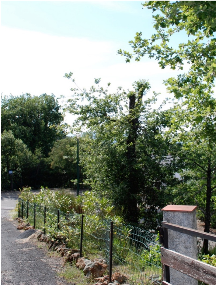
Photo 3 : Consignes mal comprises : arbre non pas élagué mais carrément étêté, en voie de régénération.

Au-delà de l'incompréhension, les difficultés relèvent également de réticences que l'on pourrait qualifier de patrimoniales : « Les gens ont mal compris les directives. [...] Le domaine est un endroit que je trouve agréable parce qu'il y a des arbres et maintenant il y a des poteaux dans les jardins. J'ai essayé de leur dire [au voisin] mais il l'a mal pris » (enseignante retraitée). À l'instar de ce qui a été observé dans certaines communautés américaines (Daniel et alii, 2003), le débroussaillage heurte en effet de plein fouet les valeurs, notamment esthétiques, qui ont justement présidé aux choix résidentiels. Comme souligné par Pinson et Thomann pour la région aixoise, les populations qui ont fait le choix de s'installer dans ces lotissements forestiers « y projettent un imaginaire et y défendent des valeurs qui pèsent de tout leur poids sur les choix ou non choix d'aménagement » (Pinson et Thomann, 2004, p. 5).