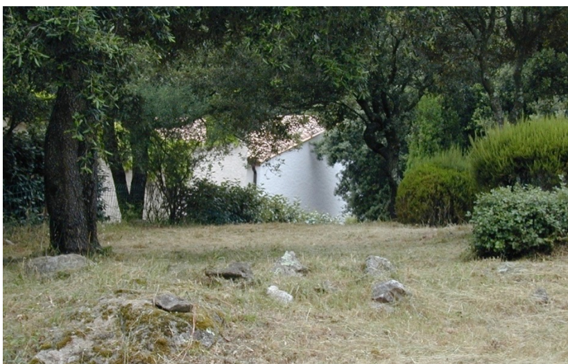
Photo 4 : propriété débroussaillée mais avec maintien des arbres à proximité immédiate de la maison. Le danger vient tout particulièrement du contact des branches avec la toiture.