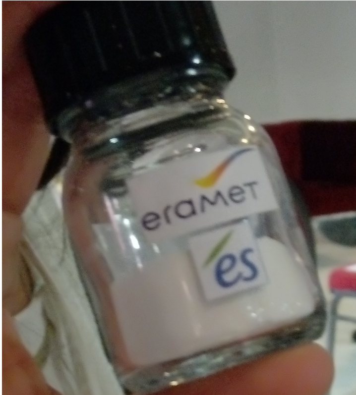
Lithium extrait en Alsace