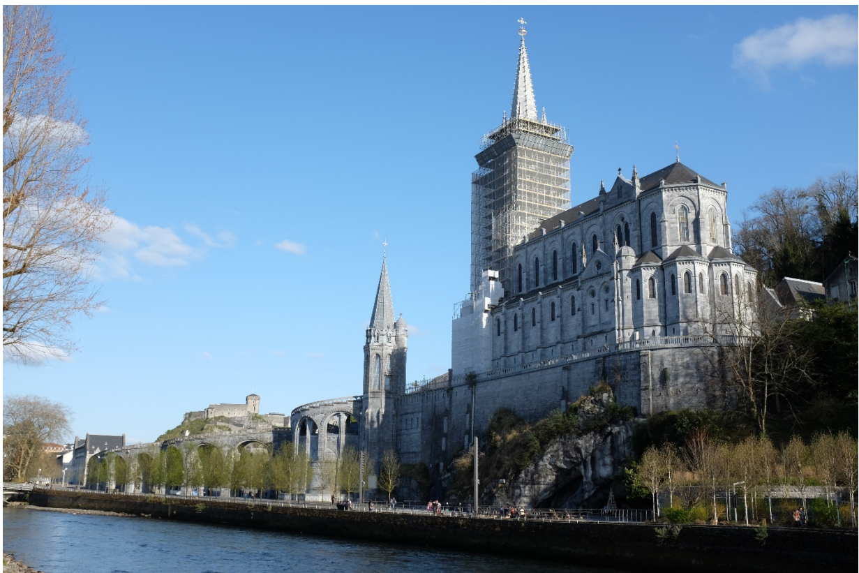
Figure 1 : Sanctuaire Notre Dame de Lourdes, 27 mars 2021