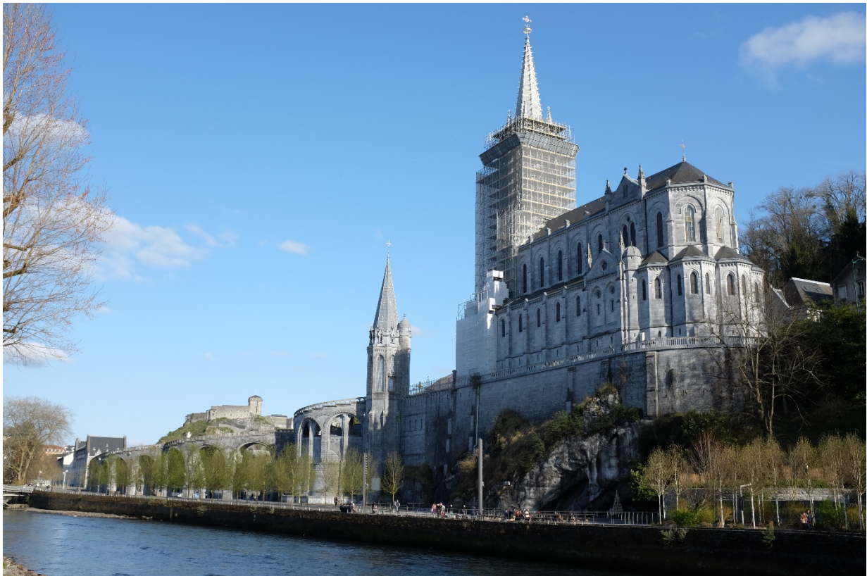
Figure 1 : Sanctuaire Notre Dame de Lourdes, 27 mars 2021