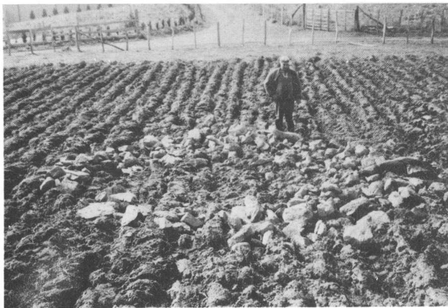
Fig. 3. Photo — Vue de la couronne des pierres après les labours et avant la fouille. Monsieur IBAR inventeur du monument.

Elle est assez pauvre en renseignements, surtout pensons-nous du fait des perturba-