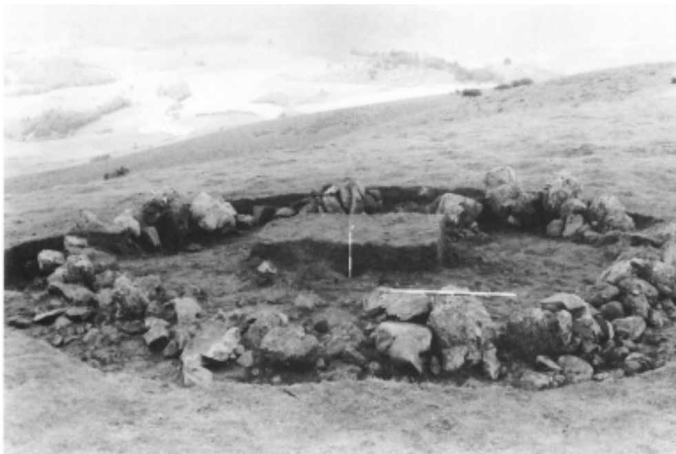
Photo 1: Vue d'ensemble du monument. Vue prise du Sud. Il persiste une partie de la banquette centrale.