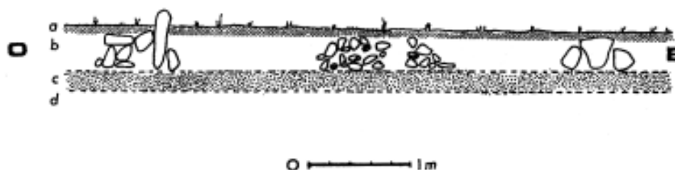
Fig. 2. Coupe suivant l'axe E.O. a: couche d'humus; b: couche de terre plus claire; c: couche de galets roulés; d: le poudingue délité sous-jacent.

Enfin quelques pierres, que l'on peut supposer de calage (à moins qu'elles ne soient "rituelles"), de même nature géologique, ont été disposées sans aucun soin entre les gros blocs, ou à leur face externe.