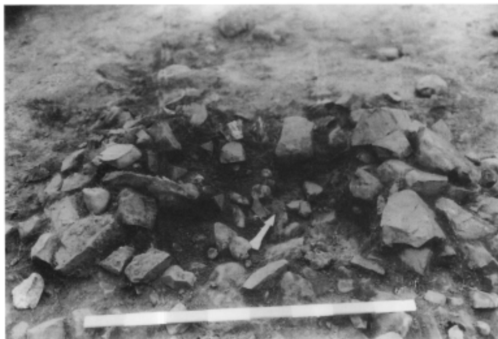
Photo 4: Amas central. La flèche indique le Nord. L'excavation centrale est bien visible.

disposés en 2 ou 3 couches séparées par de la terre et de petits dépôts de charbons de bois (fig. 3, ch); ces derniers ont été recueillis pour examen anthracologique, et datation au ^{14}\text{C} .