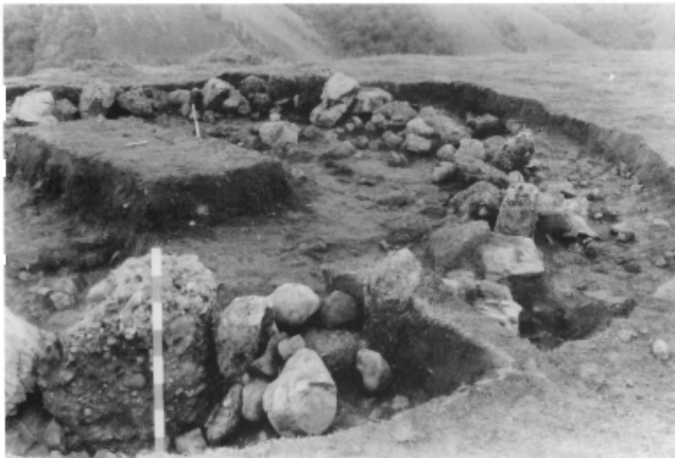
Photo 3: Vue prise du N.O. On voit la dimension beaucoup plus modeste des témoins dans le secteur Sud (à droite de la photo).