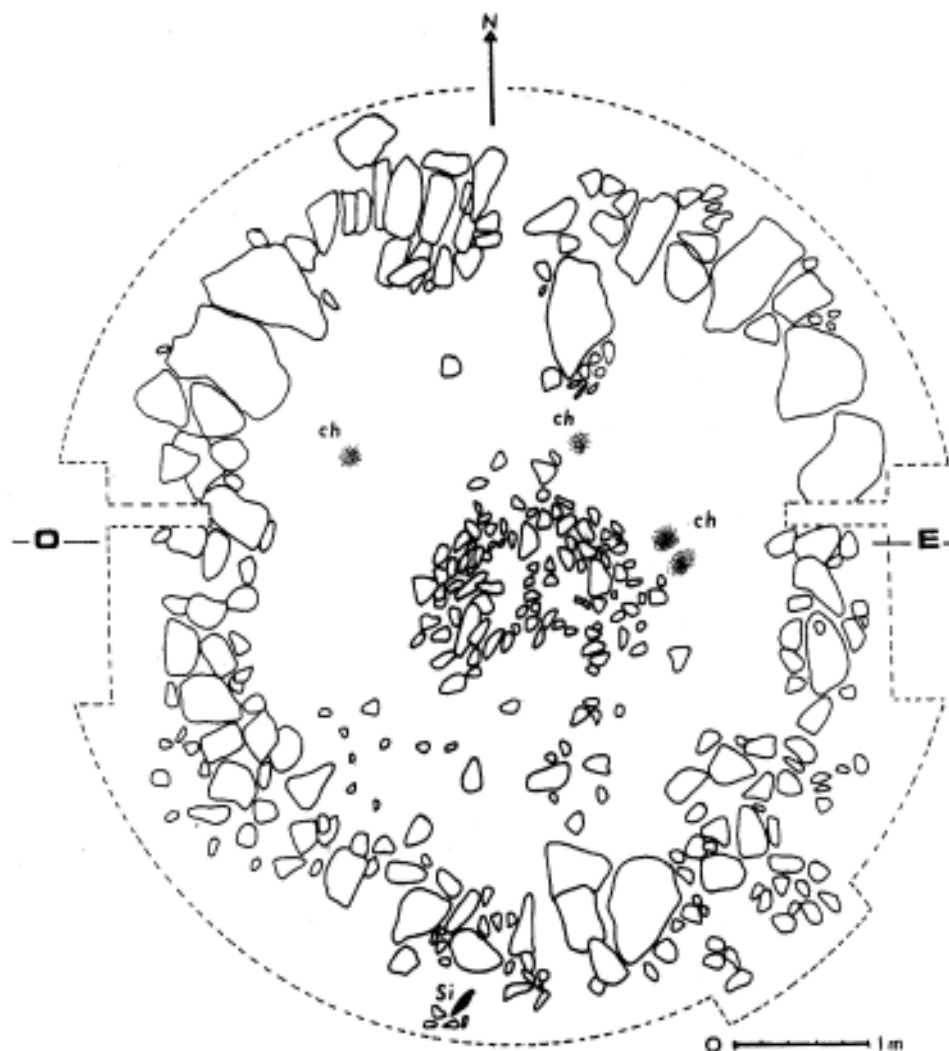
Fig. 1. Vue d'ensemble du monument, ch: charbons de bois - Si: lame de silex.