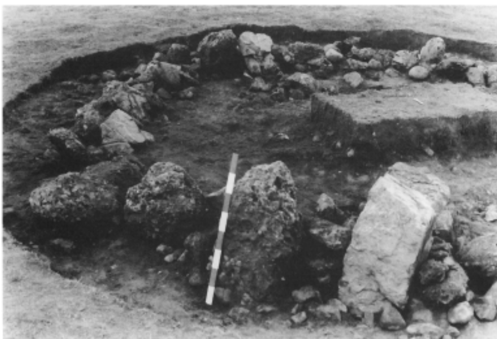
Photo 2: Vue prise du N.E. Noter les dimensions des témoins du péristicalithe dans ce secteur

Entre le péristicalithe et la région centrale, on a trouvé en 4 endroits, dans le secteur N. (fig. 1, ch.) de petits amas de charbons de bois, et de terre noircie reposant sur le paléosol caillouteux. Tous ont été soigneusement recueillis.