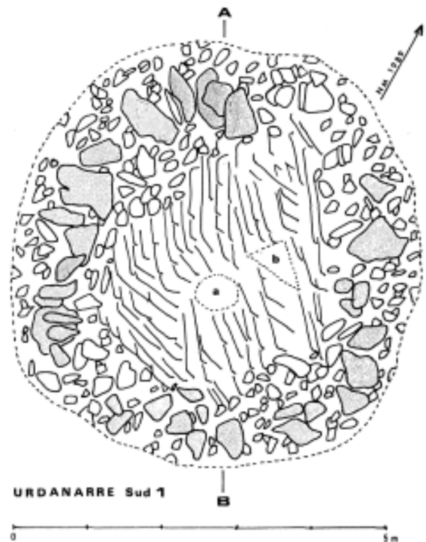
Fig. 1.— Le cercle Urdanarre Sud 1. après la fouille. En gris, les blocs de quartzite du pérystalithe; autour les plaquettes de flysch délités (en blanc). Toute la région à l'intérieur du cercle est occupée par les filons de flysch. Noter la petite dépression en cuvette (en «a») et celle, triangulaire (en «b») où ont été recueillies les quelques particules carbonées.

Elle affecte une forme grossièrement circulaire d'un diamètre d'environ 5 m. Le cercle n'est ni parfait (Légèrement oval à grand axe NO-SE) ni complet: quelques éléments sont absents dans le secteur N-NE (Fig. 1). Les blocs de quartzite dont est formée cette couronne (38 au total) sont parfois assez volumineux pouvant atteindre près d'un mètre de long et 0.20 m. à 0.30 m. d'épaisseur. Les dimensions sont très variables mais, de toute façon, ils ne