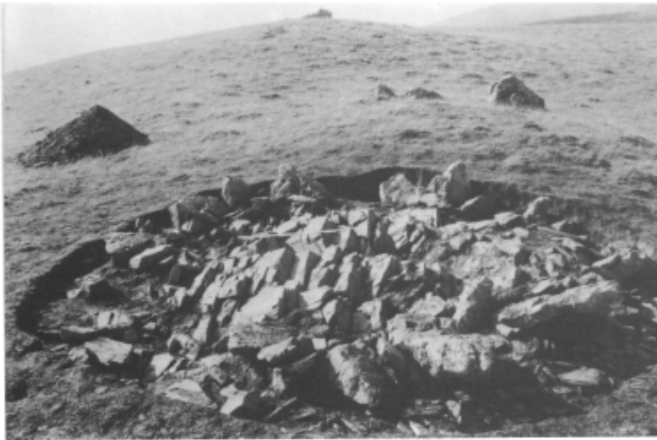
Photo 4.— Le cercle, vu du NO. On remarque l'absence de témoins sur la gauche (NE), et, à droite, (O NO), les blocs couchés sur le lit de plaquettes de flysch.

semblent pas avoir été taillés mais simplement prélevés sur le filon rocheux d'origine situé à 80 m. au S-SO). Certains de ces blocs ont été plantés dans un sol assez meuble, tels ceux de la moitié Est (Fig. 2, en B), d'autres n'ont pu qu'être posés sur un paléosol préalablement décapé de sa fine couche d'humus, tels ceux de la moitié Ouest (Fig. 2, en A).