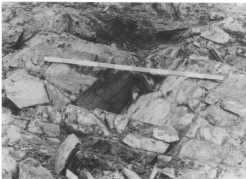
Photo 6.— La dépression triédrique au premier plan, et la dépression en cuvette en second plan. Vue prise du NE.

vandalisme, mais remonter à l'origine, sans que la raison en soit bien claire.