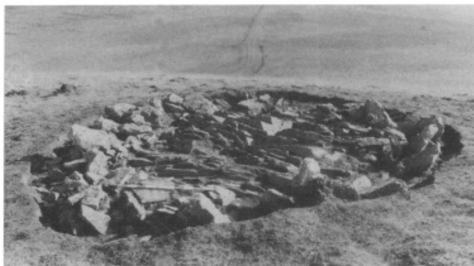
Photo 2.— Le cercle, vue du SO. Noter les filons rocheux, au centre, orientés SE-NO.