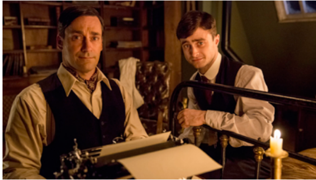
Fig. 1 : Jon Hamm (le double, Nika âgé) et Daniel Radcliffe (Nika jeune).

Pour un résumé de l'histoire et une explicitation de la structure narrative imbriquée, entre le récit cadre de 1917-1918 et le récit-encadré de 1934-1935, nous renvoyons à la chronologie que nous avons établie dans un article sur la figure du médecin-écrivain dans cette série britannique et dans l'œuvre du médecin-écrivain Martin Winckler 2 .