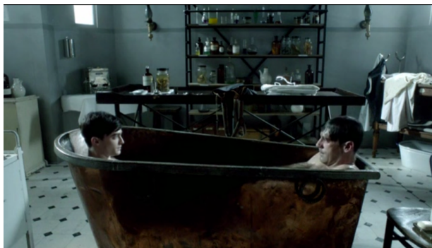
Fig. 2 : Un double bien envahissant (1.4).

avec l'affrontement pour récupérer le livre... que le double finit par manger pour mettre définitivement fin à la lecture.