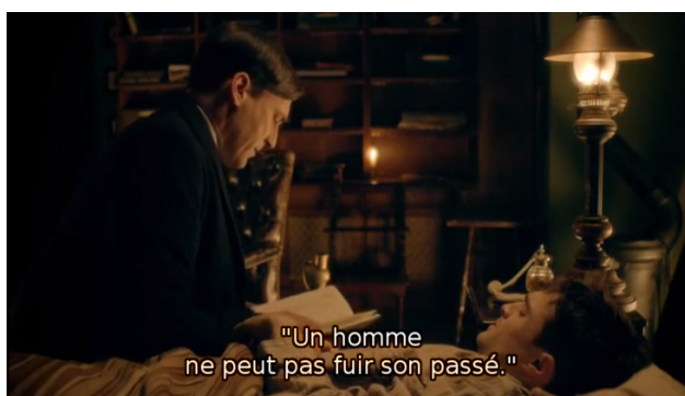
Fig. 3 : Le double relit à Nika les notes de son carnet (2.1).

Comme Nika l'écrit dans son carnet, lu par le double ( fig. 3 ), « un homme ne peut pas fuir son passé » (trad.) 3 ; alors puisqu'on n'échappe pas à ses souvenirs, passé et présent sont ensemble à l'écran. Et cette image du double en train de lire à voix haute le journal intime du jeune médecin morphinomane en est l'exacte application : si l'on a parfois l'impression que c'est l'homme qu'il deviendra qui apparaît avec le jeune Nika, cette scène montre que l'on doit envisager aussi la série autrement. L'acte de lecture replonge l'homme plus âgé dans ses souvenirs ; il n'est plus l'image de ce qu'il deviendra mais de ce qu'il a été. Il est la version désabusée et cynique du jeune médecin optimiste qu'il était à ses débuts, quand ce n'est pas parfois l'inverse qui se produit.