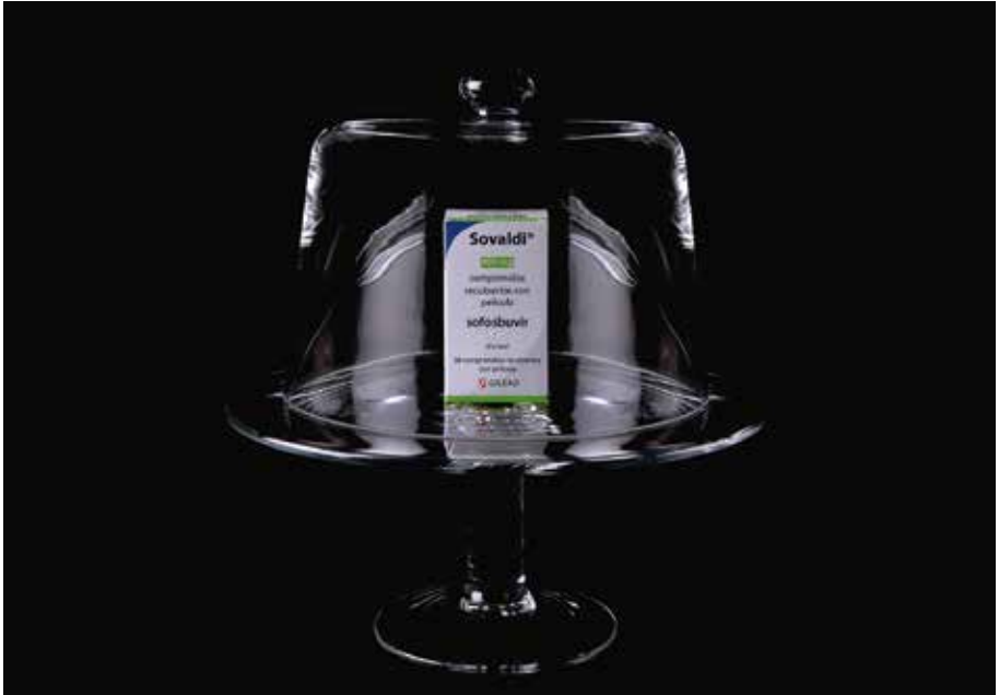
Figure 6. – Rafael Díaz – série Antirretrovirales , Sovaldi, Photographie, 90 × 120 cm, papier Barita fine art, 325 gr., 100 % coton Hahnemühl, impression encres à pigments minéraux, 2015.