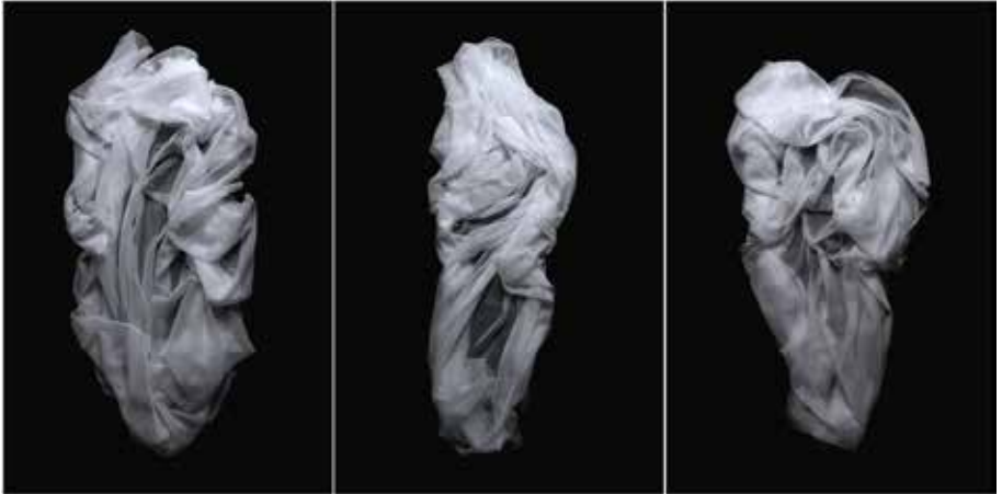
Figure 8. – Rafael Díaz – série Antirretrovirales , Tríptico de la Resurrección, Photographie, 120 × 90 cm, papier Barita fine art, 325 gr., 100 % coton Hahnemühl, impression encres à pigments minéraux, 2009.