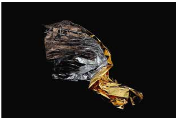
Figure 7. – Rafael Díaz – série Antirretrovirales , Exitus V, XII, VII, Photographie, 120 × 90 cm, papier Barita fine art, 325 gr., 100 % coton Hahnemühl, impression encres à pigments minéraux, 2009.