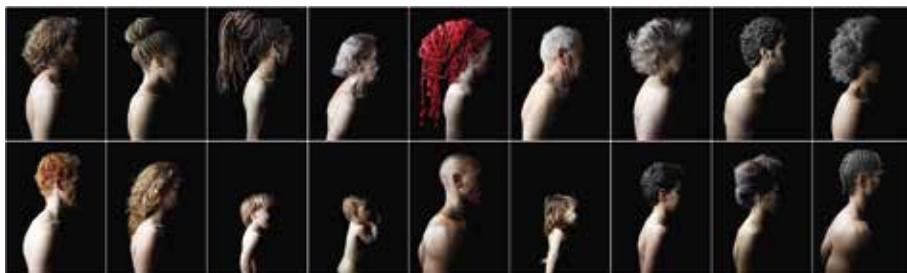
Figure 5. – Rafael Díaz – Polyptyque de la série Anonymous I . 240 x 810 cm, No-Retrato I, II, III, IV, V, VI, VII, VIII, IX, X, XI, XII, XIII, XIV, XV, XVI, XVII, XVIII, Photographie, 120 x 90 cm, papier Barita fine art, 325 gr., 100 % coton Hahnemühl, impression encres à pigments minéraux, 2014.