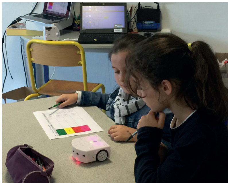
3 Initiation à la robotique avec le robot Thymio, école Bretagne-de-Marsan, RPI de la vallée des Longs, Landes

Après deux années de fonctionnement, le bilan de l'expérimentation est extrêmement positif. La première année (2016-2017) a été consacrée au déploiement des kits pédagogiques, à la formation et à l'accompagnement des enseignants du primaire sur les trois secteurs de collèges. Ainsi, sur la base de dix écoles primaires partenaires, nous