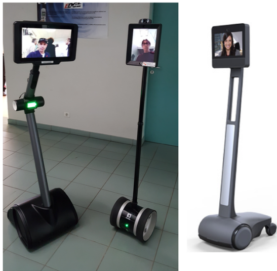
Figure 1 : Exemples de robots de téléprésence (de gauche à droite : Ubbo expert / Double / Beam)

Un robot de téléprésence peut être vu, d'un point de vue technologique, comme un système de visioconférence mobile. Le support au logiciel de visioconférence est une tablette (la tête du robot), positionnée sur une base mobile (les pieds du robot), qui est pilotée à distance par l'étudiant. Indéniablement, le fait que le robot puisse se déplacer lui confère une dimension « humaine » bien plus marquée que la simple visioconférence. La dimension sociale est elle aussi très impactée par la présence de cet objet. Sa capacité d'autonomie et de déplacement dans l'espace distant en font un « être » singulier. La forme et le design du robot sont aussi des points extrêmement importants pour l'acceptabilité de la présence du robot en classe. Plus on se rapproche d'une forme humanoïde, et plus l'objet dérange, parfois jusqu'à provoquer des réactions de rejet. Il faut donc trouver le juste équilibre entre une forme qui rappelle la présence de l'étudiant distant, sans pour autant être trop « humain ».