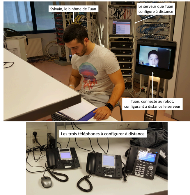
Figure 3 : Le matériel de TP de l'environnement pédagogique connecté

informatique de l'IUT comme s'ils étaient physiquement dans l'établissement, et de pouvoir interagir avec les autres objets connectés à ce réseau.