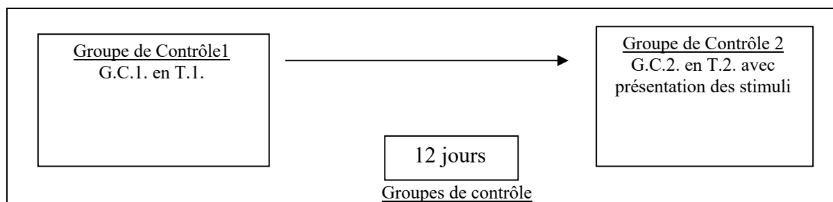
Figure 3 : Le plan expérimental pour les groupes de contrôle

Cette méthode, fondée sur « avant-après », est utilisée simultanément sur deux groupes expérimentaux et de contrôle. Bien que difficile du point de vue logistique à mettre en place, elle permet d'atteindre une meilleure validité des résultats (Michel, 2000).